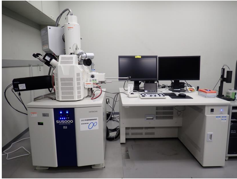
装置詳細 : https://orist.jp/jka/izumi_JKA_kiki.html